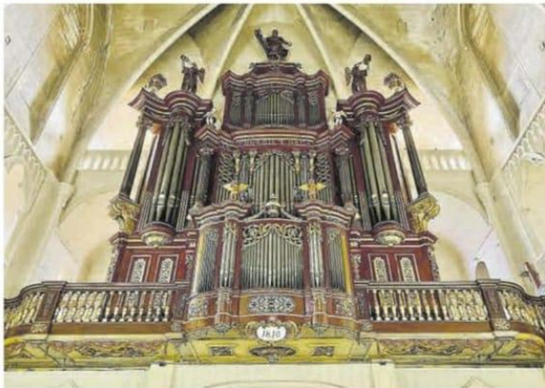
Imagen del órgano histórico de Santa María de Maó.

Las sedes de las sesiones serán la iglesia del Socors de Ciutadella